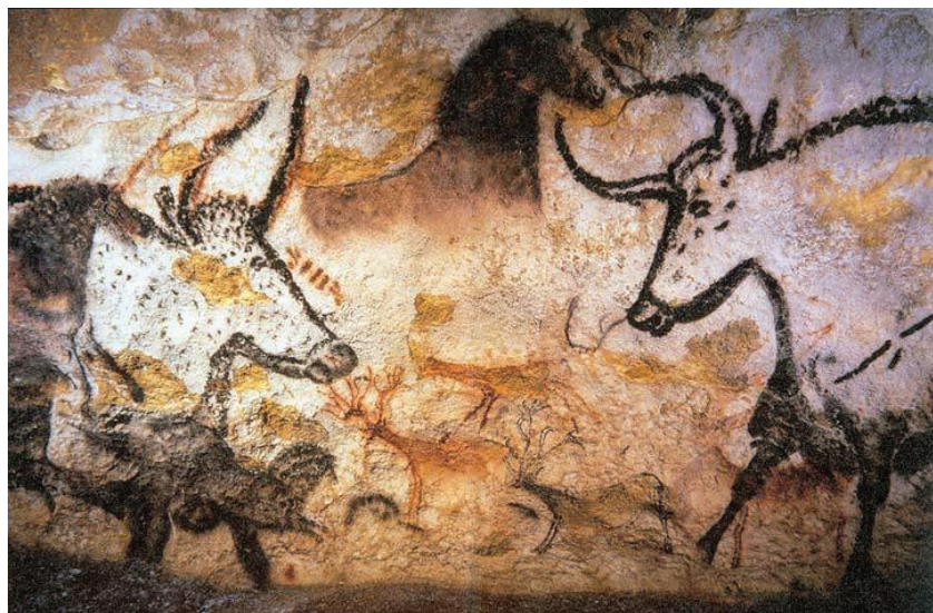
Pictură rupestră veche de peste 17.000 de ani, peștera Lascaux, Franța

Campionii acestei comunicări vizuale sunt însă artiștii. Ei nu au abandonat bucuria pe care o avem cu toții când suntem copii – de a desena. Și-au păstrat și o mare curiozitate, la care au adăugat preocuparea permanentă de a decodifica mesajele acestei lumi și a găsi metode din ce în ce mai rafinate pentru a ni le retransmite.