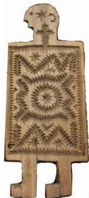
Tipar de caș - planșa 2