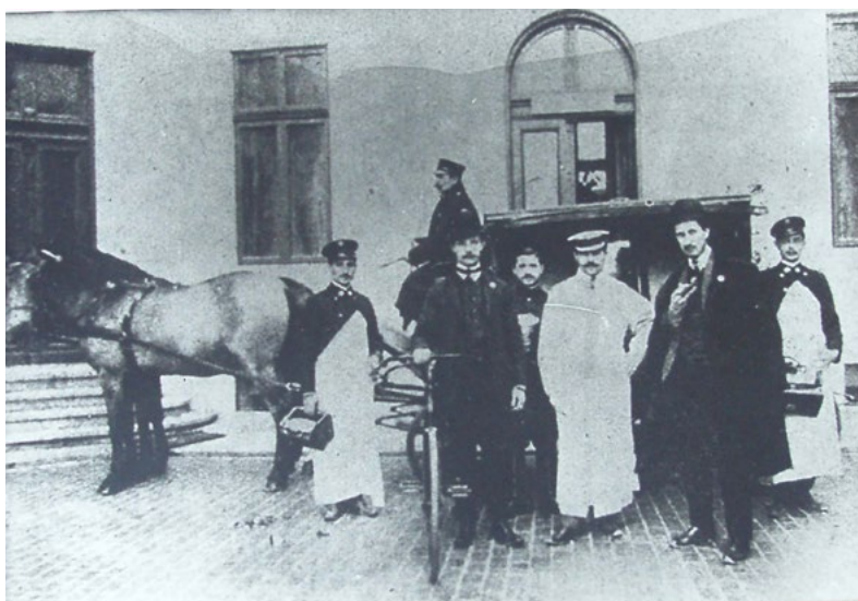
Ambulanță cu personalul medical, 1906 - Planșa 6

Doctorul Nicolae Minovici cunoștea foarte bine pulsul orașului. Deși provenea dintr-o familie înstărită și educată, medicul nu ignora celelalte categorii sociale, ba dimpotrivă, a încercat să îmbunătățească viața tuturor bucureștenilor. Unul dintre cele mai importante lucruri pe care le-a făcut a fost să înființeze prima ambulanță din București. Pentru că nu exista un asemenea serviciu în oraș, oamenii aveau de suferit; cei mai mulți care ajungeau în situații critice aveau șanse foarte mici de supraviețuire. Prima ambulanță a bucureștenilor a fost o trăsură trasă de cai, dotată cu echipamentele necesare și conduse de un vizitiu. Uneori, când starea pacientului era foarte gravă, medicul mergea înaintea ambulanței pe bicicletă pentru a interveni mai repede.