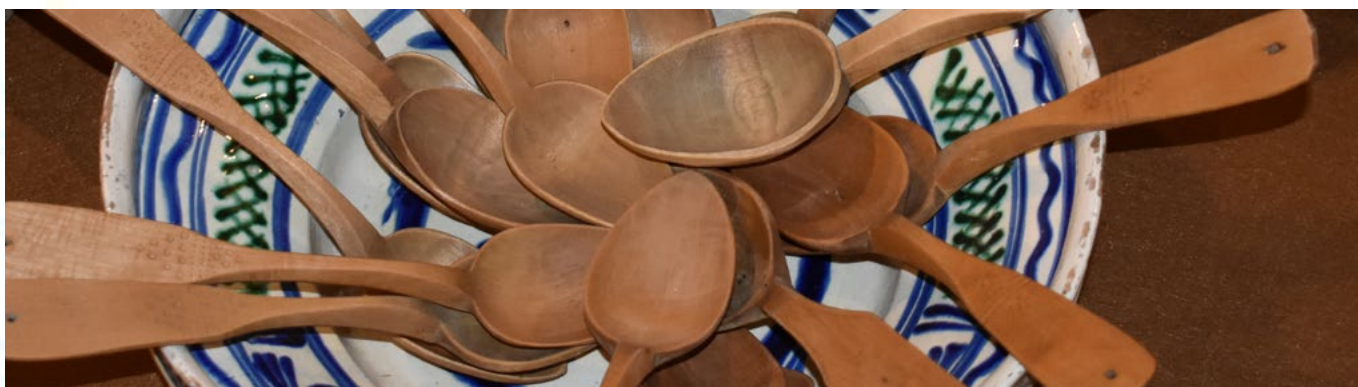
Planșele 7, 8 și 9

Exponatele din colecția de artă populară a doctorului Nicolae Minovici (ceramică, țesături, costume populare, crestături în lemn) sunt ornamentate, simplu sau somptuos, cu o mulțime de motive alcătuite din linii, puncte sau pete de culoare. Fie că sunt covoare țesute, ulcioare pictate, ștergare brodate, ouă decorate, crestături pe linguri, puteți să încercați să refaceți, schițând, oricare dintre aceste obiecte.