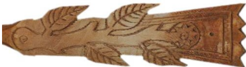
Planșele 7, 8 și 9